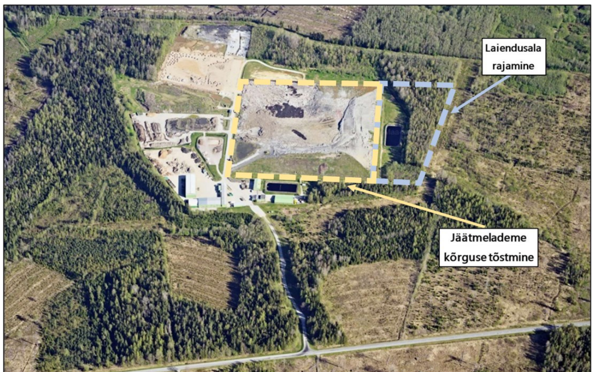
Joonis 2. Vaade Väätsa prügilale (, 05.05.2024)